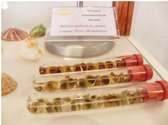
Moluscos aquáticos do gênero Lymnaea , Physa e Biomphalaria

Num microscópio óptico pode ser visualizado em lâmina um exemplar de Schistosoma mansoni fêmea passando pelo ginecóforo do macho, helminto parasito das veias mesentéricas e hepáticas que causa a ESQUISTOSSOMOSE ou BARRIGA D'ÁGUA, doença transmitida pelo caramujo Biomphalaria .