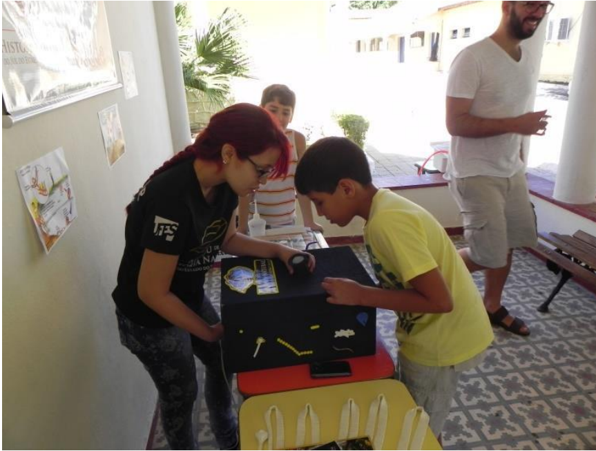
Visualização e detecção do teste de limpeza das mãos

E para você que gostaria de saber se está lavando as mãos corretamente, ainda na área da parasitologia, contamos com a atividade do “Teste de limpeza das mãos”, elaborado para se perceber as regiões da nossa mão que não lavamos corretamente e deixamos passar despercebido, podendo comprometer a sua saúde.